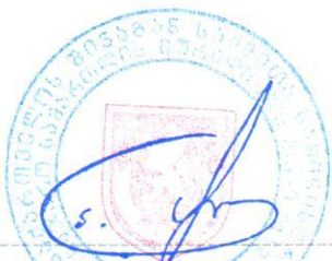
დირექტორის მოადგილე ავთანდილ ჩიტაძე